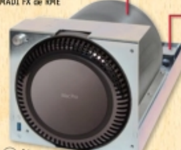
C Module de montage de l'ordinateur (Inclus)

Économisez un slot en y installant les connecteurs utilisés par des cartes comme la RED ROCKET-X ou la HDSPe MADI FX de RME