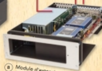
B Module d'extension de cartes PCIe (Inclus)

Alimentation universelle 300W Un connecteur d'alimentation auxiliaire de 75 W permet d'utiliser des cartes qui nécessitent une alimentation complémentaire